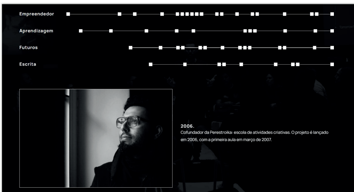
Captura de tela 1 – Linha do tempo da vida empreendedora de Tiago Mattos