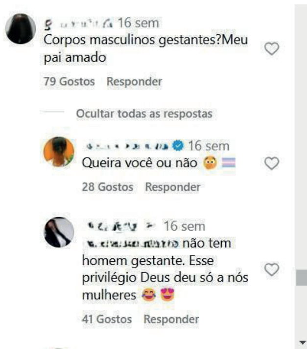
Figura 6 – Comentário em uma das publicações de pessoas trans coletadas para análise