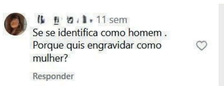
Figura 7 – Comentário em uma das publicações de pessoas trans coletadas para análise