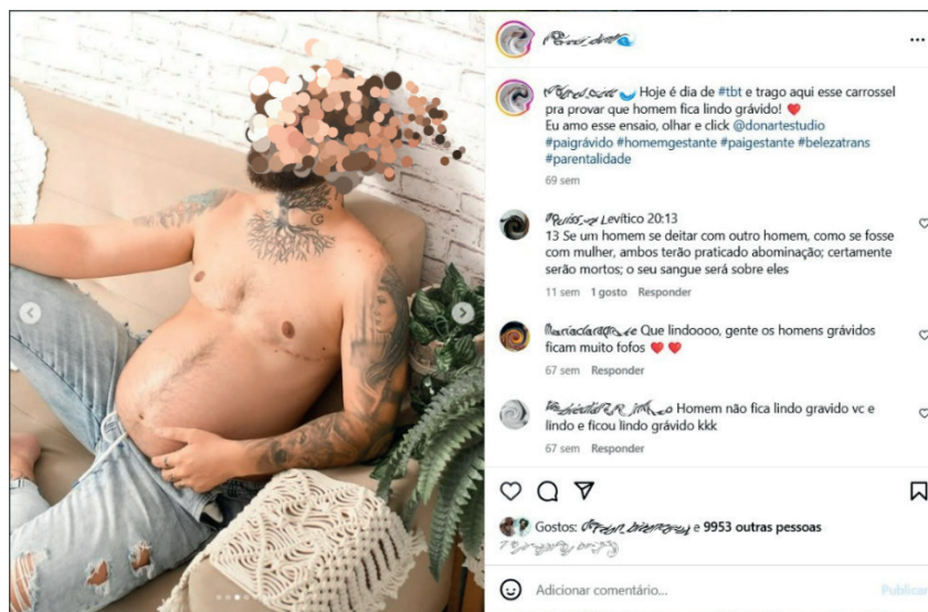
Figura 3 – Imagem de pessoa transmasculina gestante, sem camisa