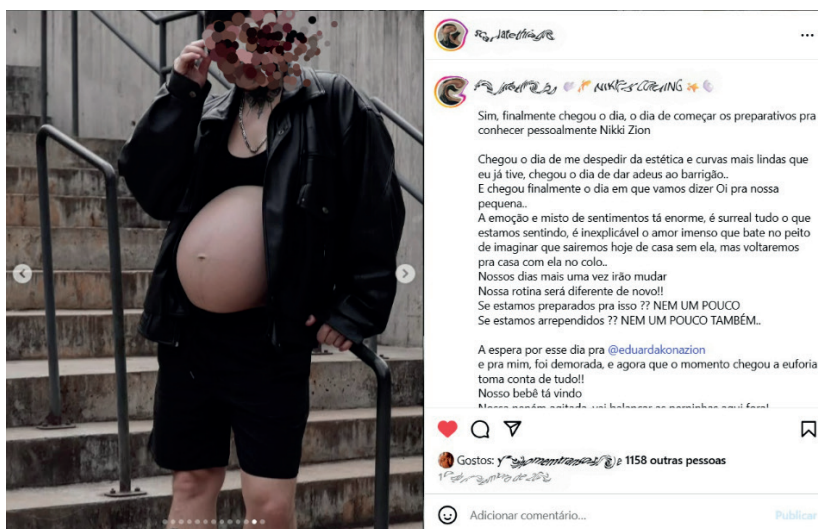
Figura 1 – Imagem de pessoa transmasculina gestante, compondo uma estética masculinizadora