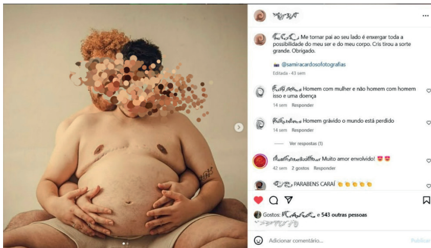
Figura 5 – Imagem de um casal de homens, sendo um deles o pai parturiente