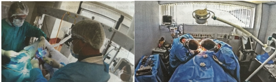
(A) Cirurgião-dentista atuando na unidade de terapia intensiva. (B) Procedimento cirúrgico realizado no ambiente hospitalar.