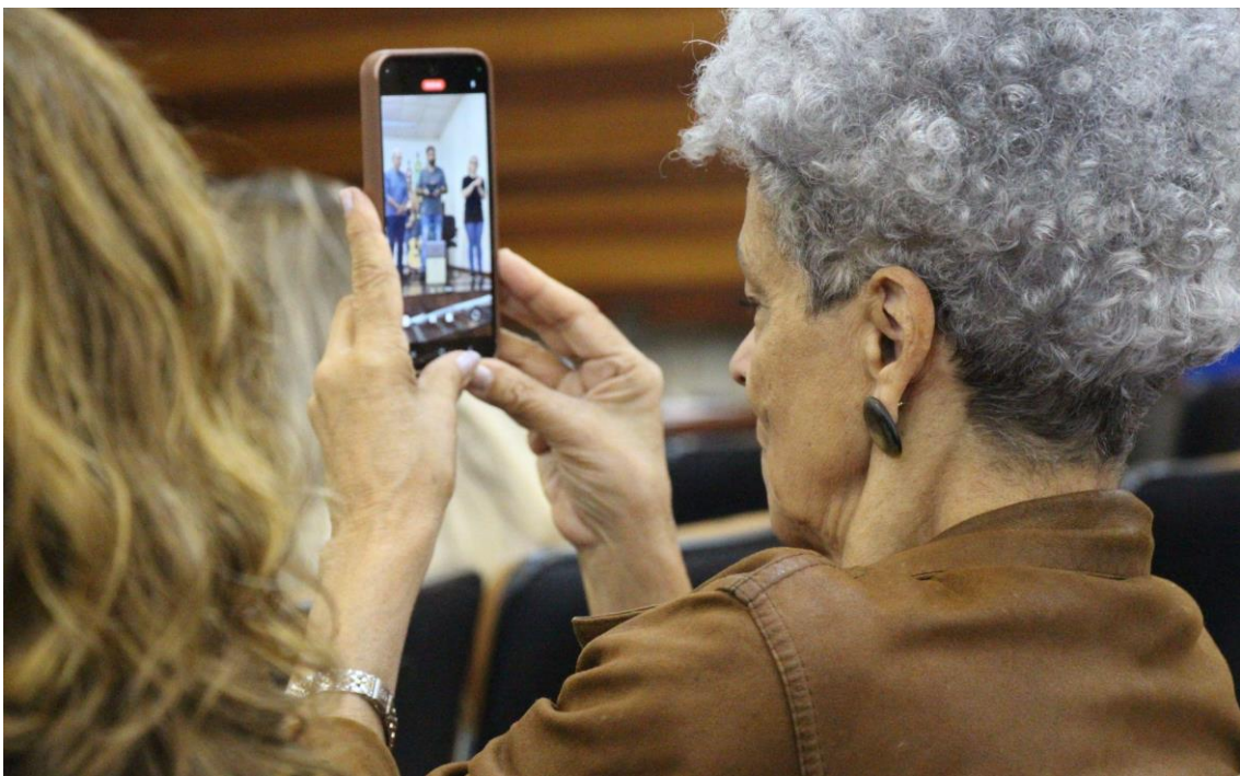
A foto da foto...