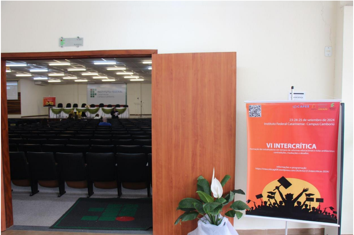
Antes do recomeço...