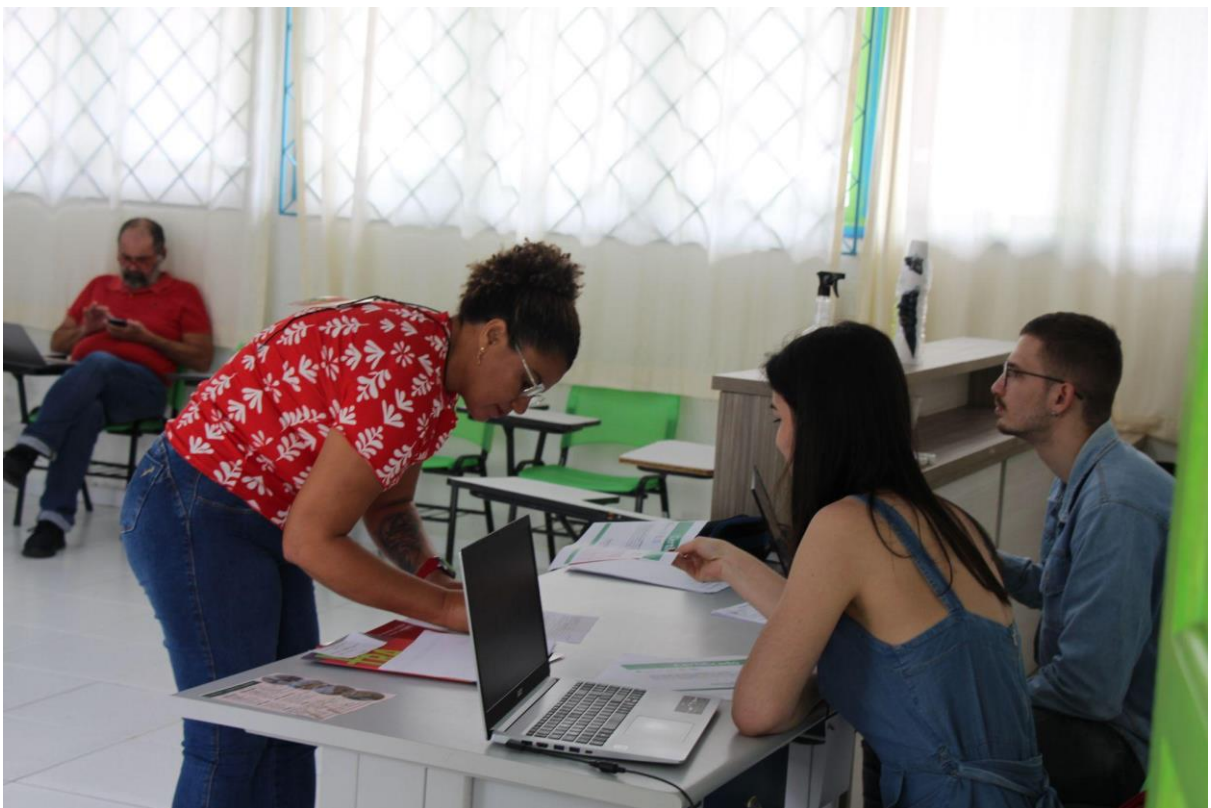
Pessoal chegando para apresentar seus trabalhos.