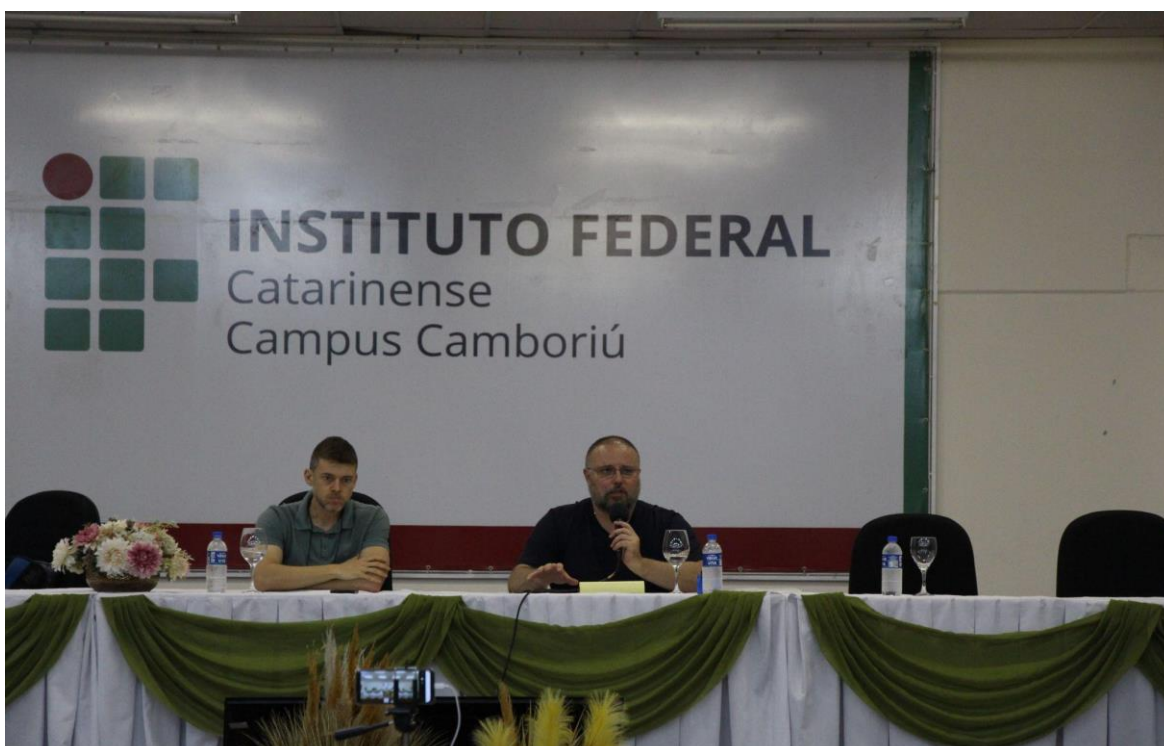
Mesa de encerramento: A CONAE, o PNE e repercussões para o campo Trabalho e Educação: táticas e estratégias de lutas.