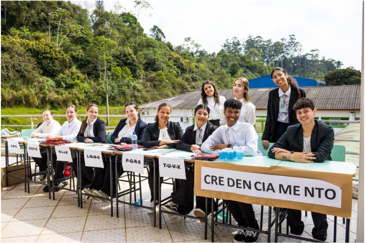
Equipe de credenciamento do IFC sempre disposta!