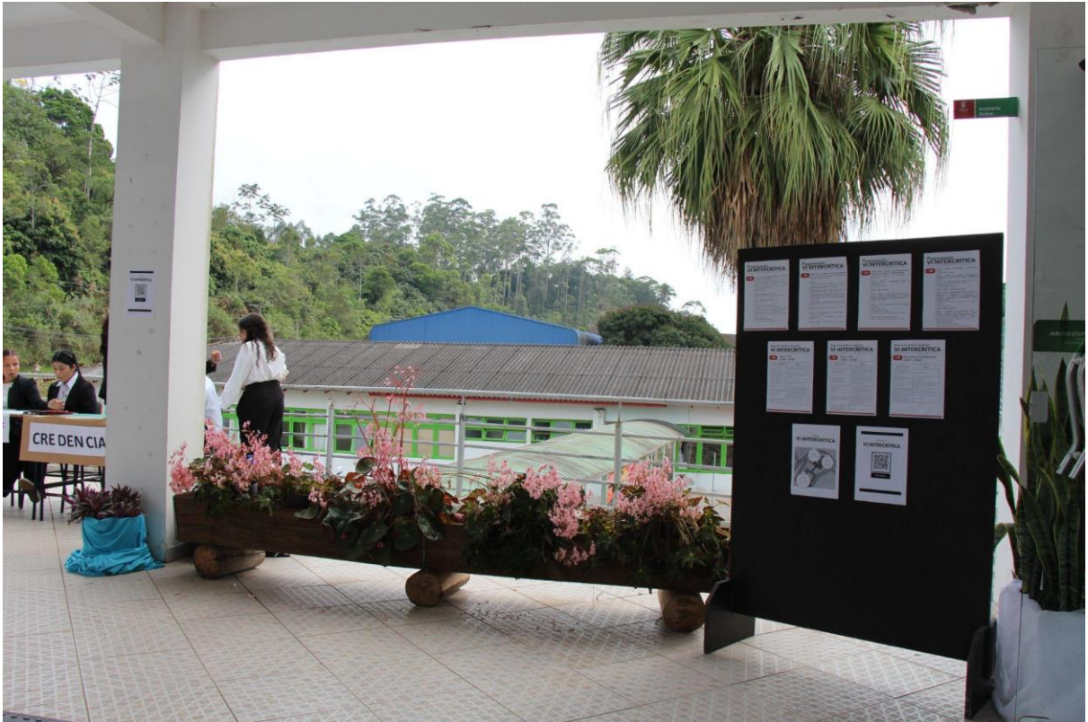
Um pouco mais do lugar...