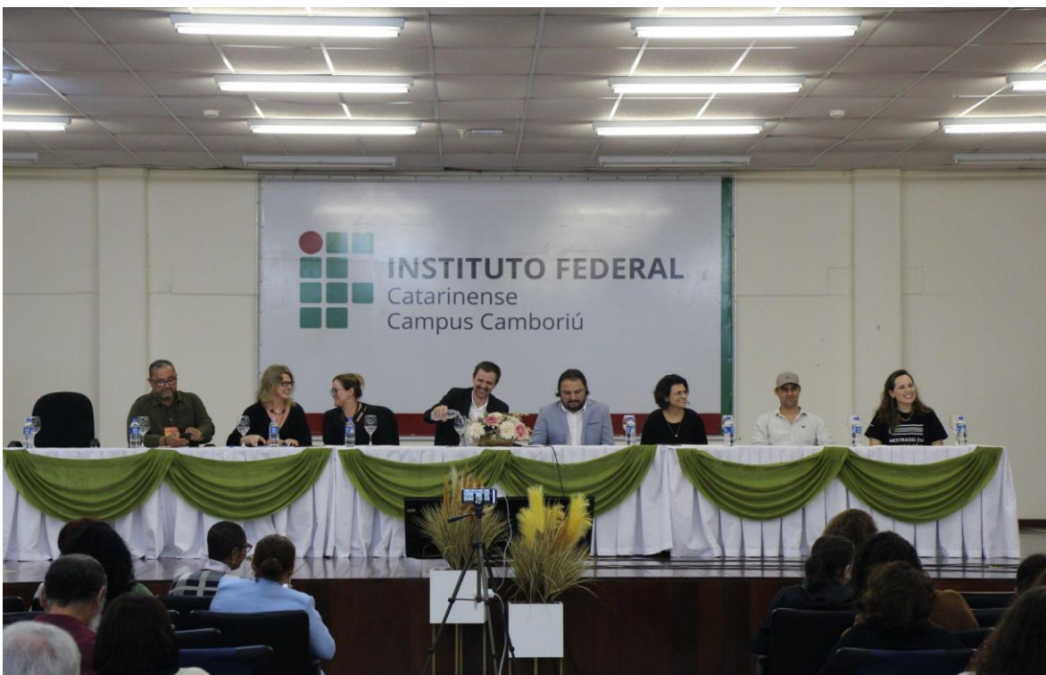
Mesa de abertura: reconhecimentos e agradecimentos!