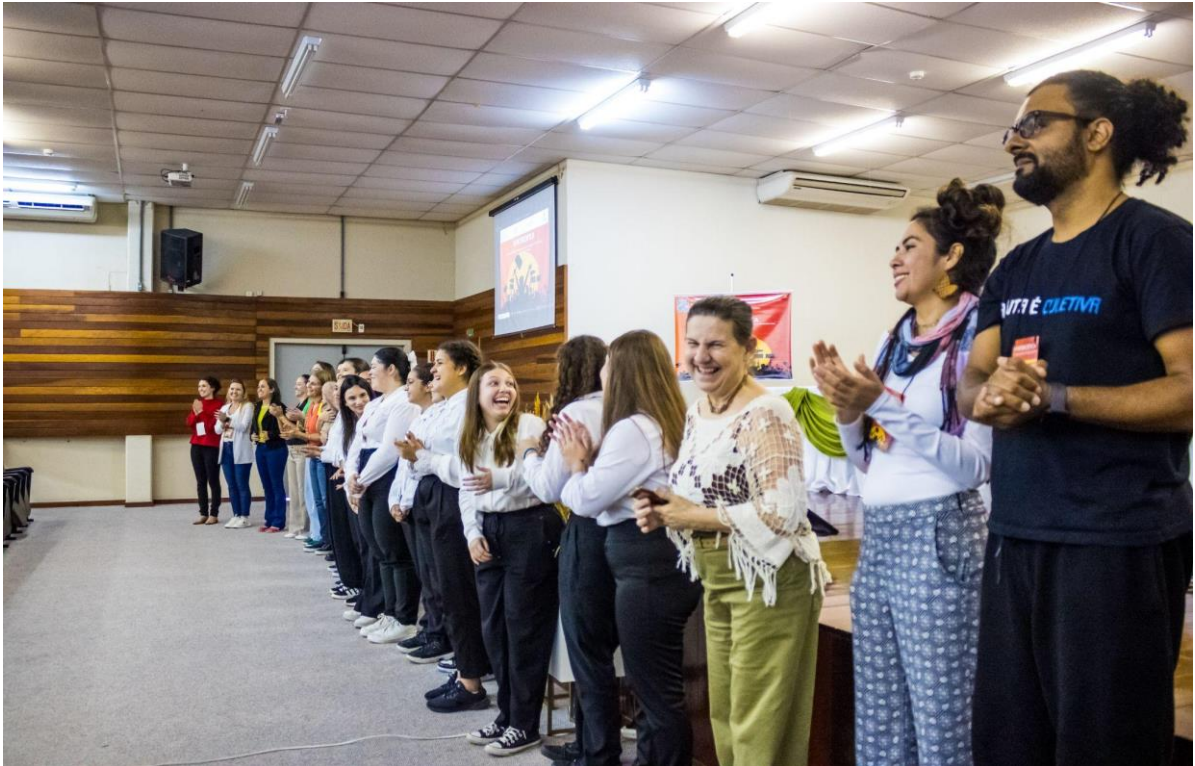
Alegrias da equipe do IFC ao final do trabalho