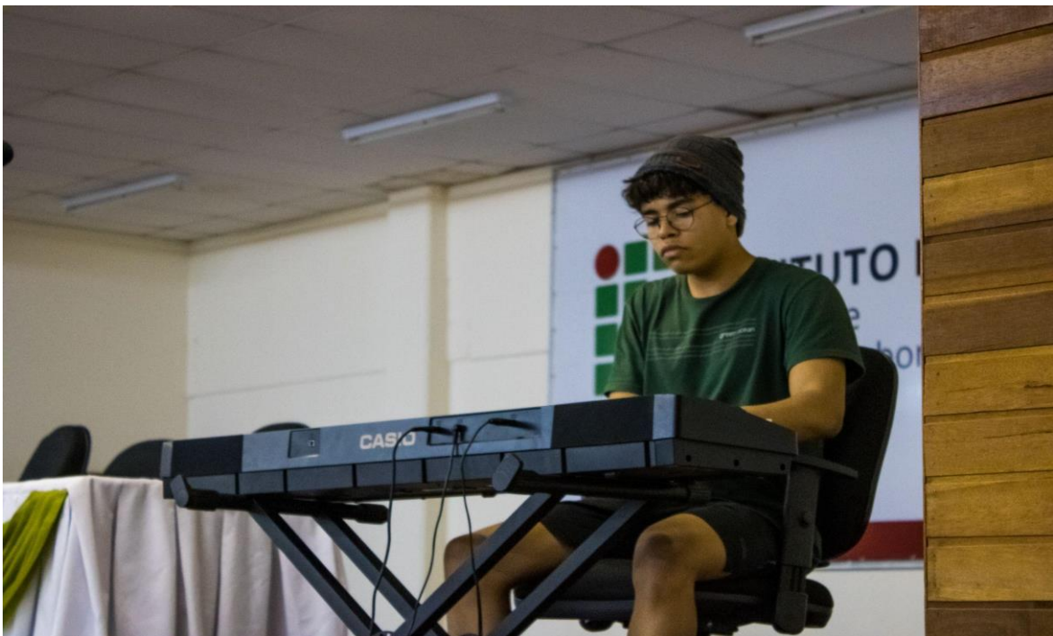
Um espaço para apreciar música, acalmar a mente e deixar-se levar...