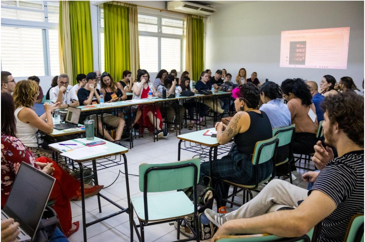
Compartilhando resultados de pesquisa