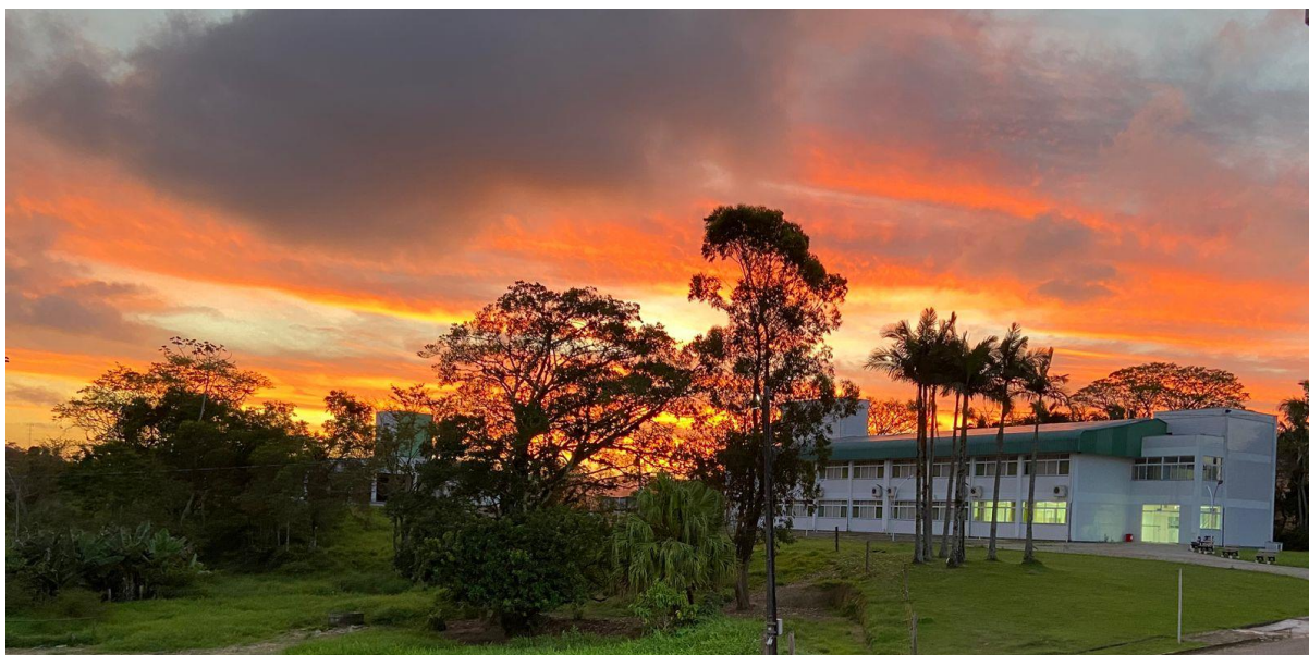
O lugar que nos acolheu: IFC - Campus Camboriú.

Escolhemos fotografias, dentre muitas, que representassem o percurso vivido no VI Intercrítica, considerando a frente - a programação oficial, momentos de discussão teóricas, filosóficas, epistemológicas e práticas de pesquisa da educação da classe trabalhadora brasileira - e o verso - bastidores, afetos e partilhas.