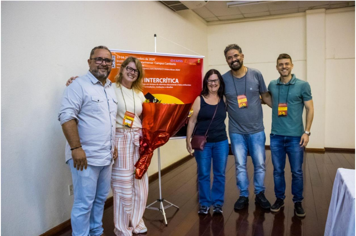
Coordenação e Comitê Científico do GT 09.