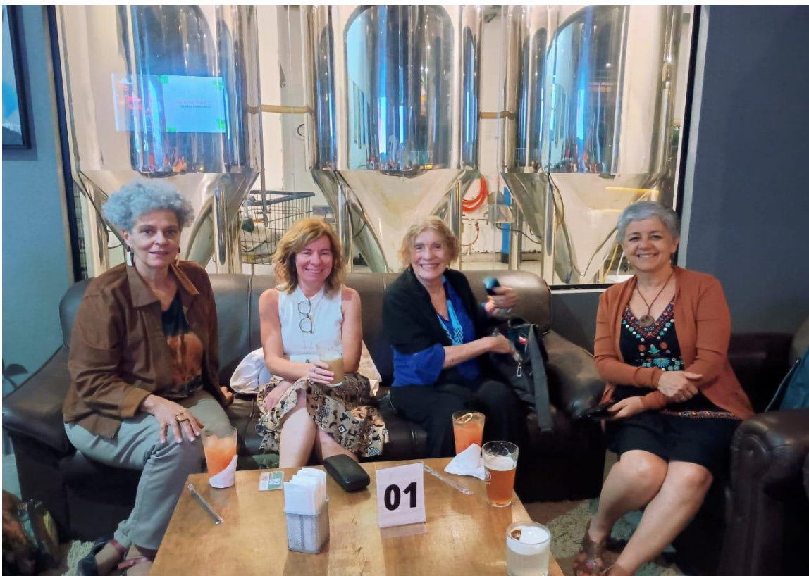
Entre escutas e registros fotográficos