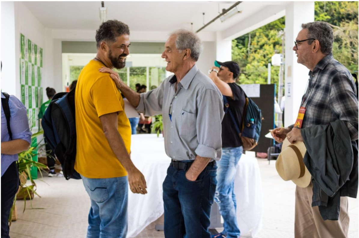
Troca de olhares e sorrisos entre uma sessão de trabalho e outra.