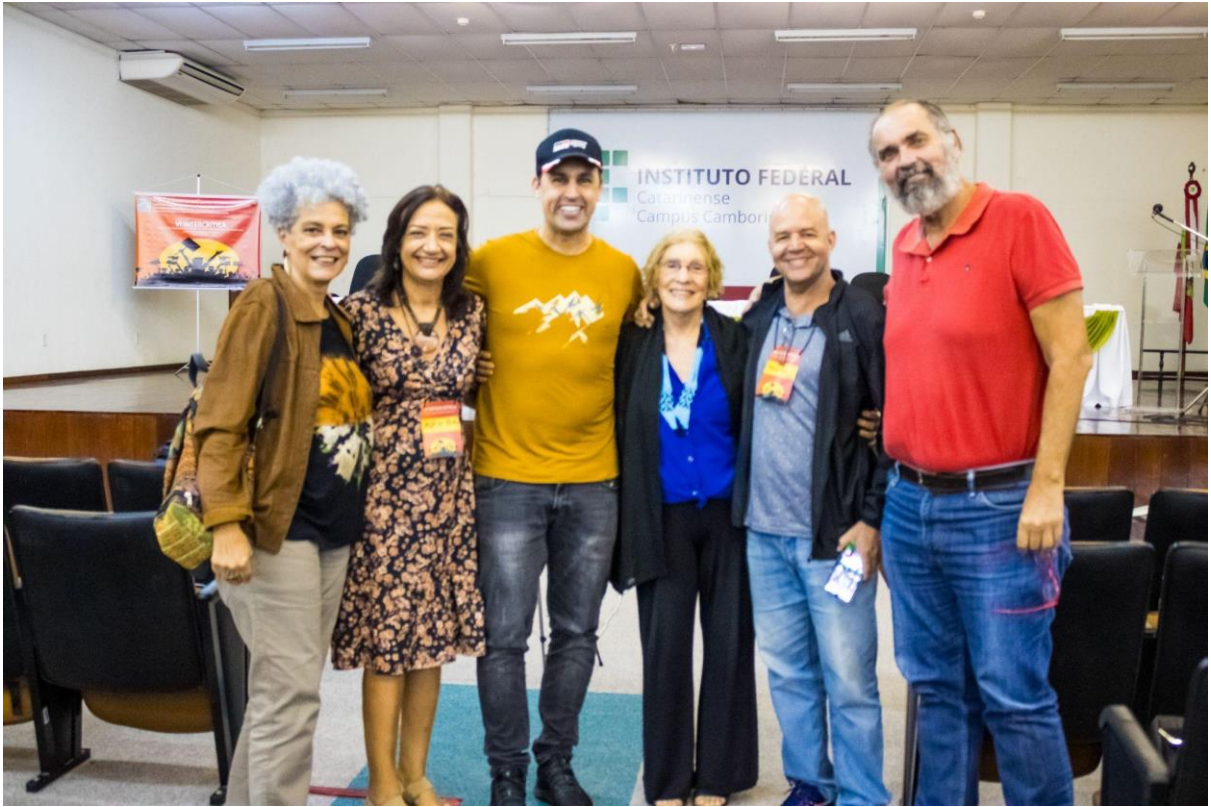
Para não esquecer...