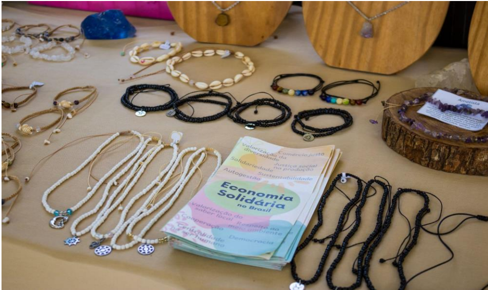
Mundos do trabalho: exposição e venda de produtos da Economia Solidária.