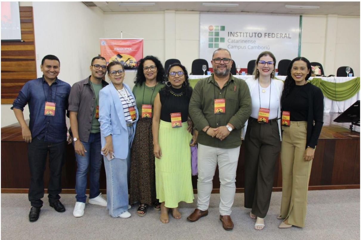
Turma do Pará! Presente!