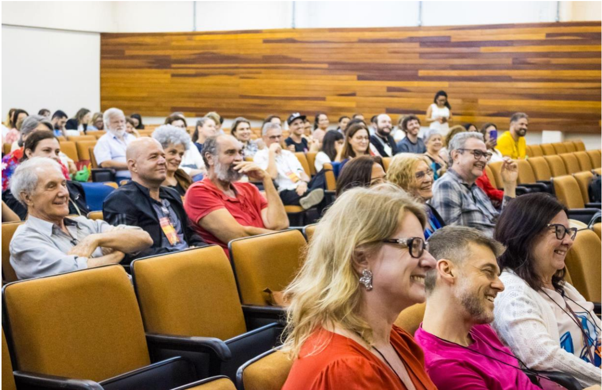
Sem palavras... só sorrisos!