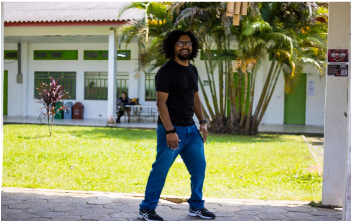
Pelos bastidores do Intercrítica, o incansável!