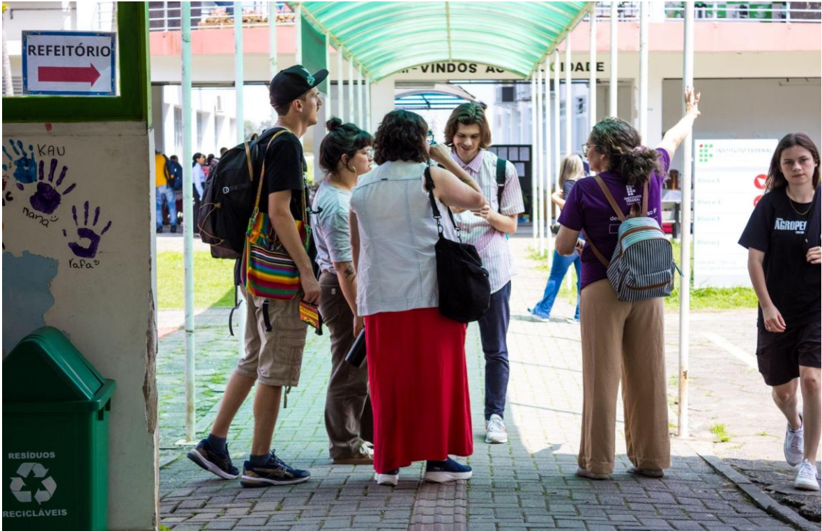
Intercrítica nos corredores: muito a compartilhar! Interesses, afetos, encontros!