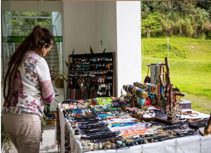
Mulheres da economia solidária presentes!